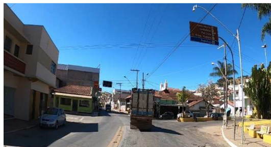
Figura 3 – Exemplo de área urbana sem vias segregadas

Considerando que ao longo do prazo da concessão poderão surgir novas travessias urbanas, e que quando não há segregação da rodovia com o tráfego urbano, a operacionalização da rodovia é dificultada, ficou estabelecido que a concessionária será responsável por operar, os serviços, conforme o grau de segregação da rodovia.